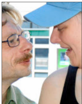
... niemals auseinandergehen.